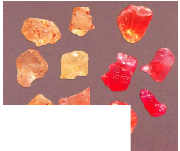
Después (dcha.) de berilio, se

El tratamiento por difusión de berilio (Be) en corindones, se descubrió a mediados de 2001 por un comerciante de corindones tailandés mientras calentaba con métodos tradicionales unos zafiros de Madagascar. Al sacarlos le produjeron una sorpresa, habían cambiado a un color amarillo intenso. Repitió el proceso varias veces y los resultados variaron de amarillo a naranja pasando por el color melocotón de los padparadscha, recubrimiento ce suceder. Pensan estropeado revisó Descubrió en el crisoberilo que s dedujo inmediatamente de los maravillosos