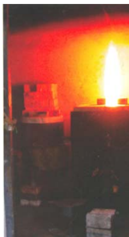
Arriba horno tradicional de llama abierta por combustión de gas. A la derecha horno eléctrico de alta temperatura.

osáceos a naranja... ue ha sido o está muy