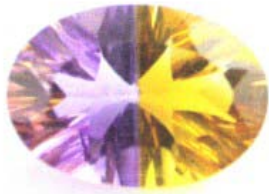
Doblete de citrino y amatista. Imita a ametrino