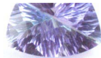
Interesante combinación de topacio azul y de amatista que dan un aspecto parecido a una tanzanita.