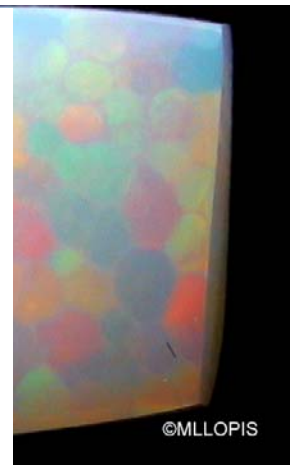
ado, de lados ligeramente go de colores. Ejemplar de de ópalo de Welo Etiopía.