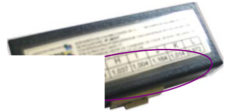
de cada muestra

El patrón de color de zirconitas es el complemento perfecto para catalogar el color de la mayoría de los diamantes, que amarillo, llam representativas c (según la nomen ejemplos compa piedra va debi desordenara, po