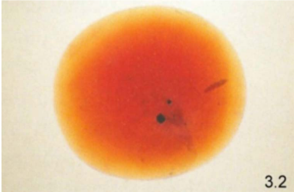
3.2- Distintos centros y capas de difusión de distintos colores.