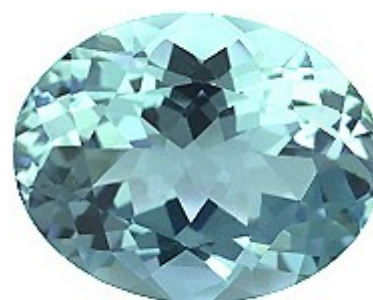
AGUAMARINA TALLA OVAL