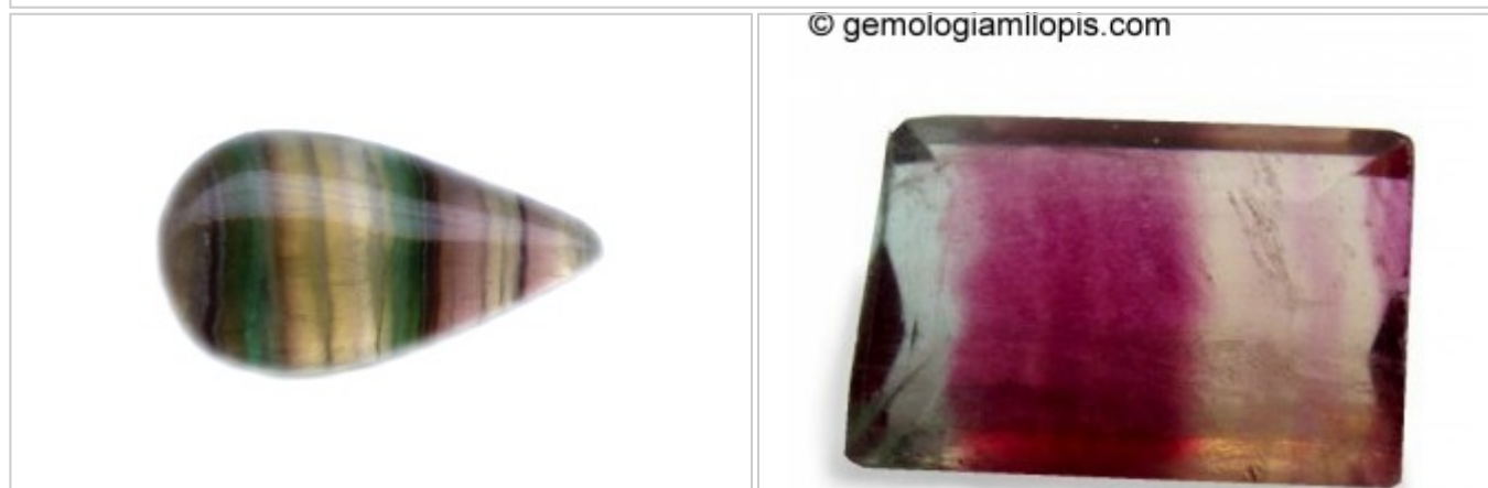
FLUORITA CON BANDAS DE COLOR FLUORITA

OBSERVACIONES TIENE EXFOLIACIÓN MUY FÁCIL Y ES NO ES MUY DURA, POR ESO NO ES RECOMENDABLE QUE SE ENGASTE EN SORTIJAS. LAS PIEZAS GRANDES SE EMPLEAN PARA ESCULPIR JARRONES Y FIGURAS. EVITAR CAMBIOS BRUSCOS DE TEMPERATURA Y EL CONTACTO CON LOS PRODUCTOS QUÍMICOS.