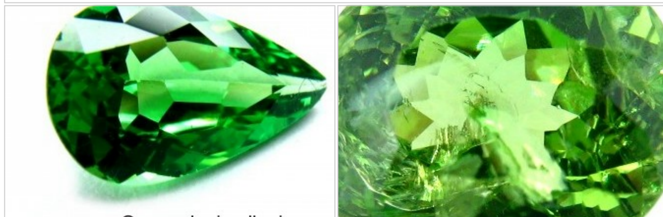
GRANATE TSAVORITA TALLA PERA TSAVORITA TALLA OVAL

OBSERVACIONES ALGUNOS GRANATES TSAVORITA TIENEN UN COLOR VERDE MUY SIMILAR AL DE LA ESMERALDA. COMO TIENE UNA DUREZA ALTA ES UNA PIEDRA APTA PARA SER EMPLEADA EN JOYERÍA. A VECES TIENEN INCLUSIONES FIBROSAS DE COLOR DORADO.