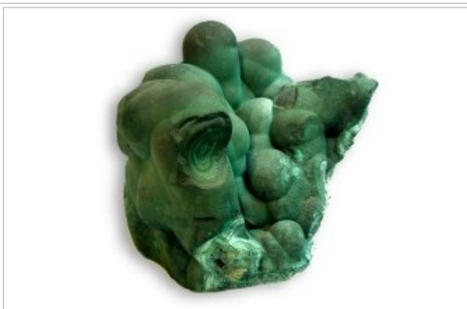
MALAQUITA EN BRUTO