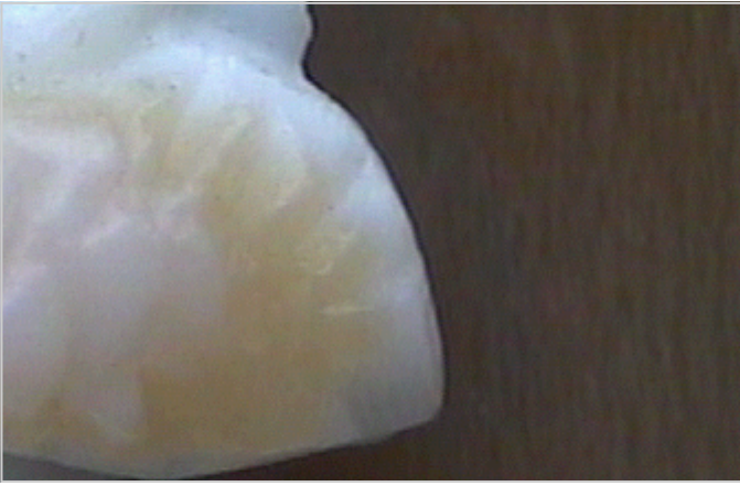
EN ESTE CAMAFEO PODEMOS VER LA ESTRUCTURA BANDEADA CARACTERÍSTICA DE LA CONCHA