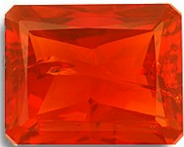
ÓPALO DE FUEGO DE COLOR ROJO INTENSO